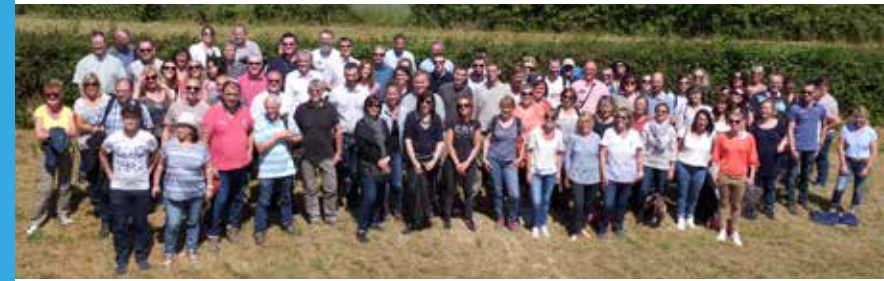
L'Agence de l'Eau Artois-Picardie : une équipe à votre service.