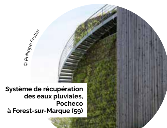
Système de récupération des eaux pluviales, Pochecco à Forest-sur-Marque (59)