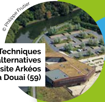
Techniques alternatives sur le site Arkéos à Douai (59)