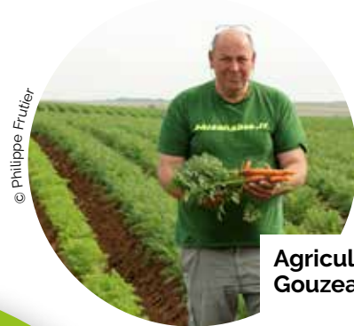
Agriculteur bio à Gouzeaucourt (59)