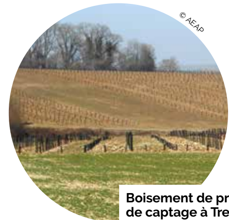
Boisement de protection de captage à Treux (80)