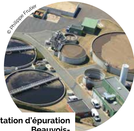
Station d'épuration Beauvois-en-Cambrasis (59)

Quelques actions financées par l'agence de l'eau.