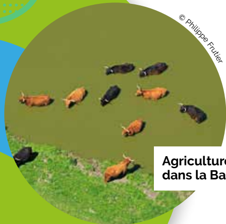
Agriculture en zones humides dans la Baie de Somme