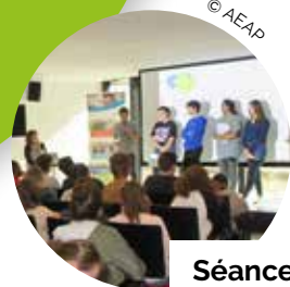
Séance du Parlement des Jeunes pour l'Eau