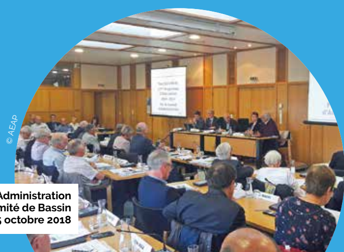
Conseil d'Administration et Comité de Bassin du 5 octobre 2018

Le 11 e programme d'intervention s'inscrit dans un contexte de maîtrise des dépenses publiques. Deux années de concertation avec les usagers de l'eau ont permis de définir les actions prioritaires pour l'eau afin de mieux anticiper nos besoins de demain. Celles-ci contribueront à donner aux générations futures les chances de disposer de ressources en qualité et quantité suffisantes.