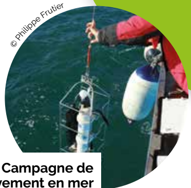
Campagne de prélèvement en mer par le Laboratoire d'Océanologie et de Géosciences de Wimereux (62)