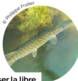
Favoriser la libre circulation des poissons